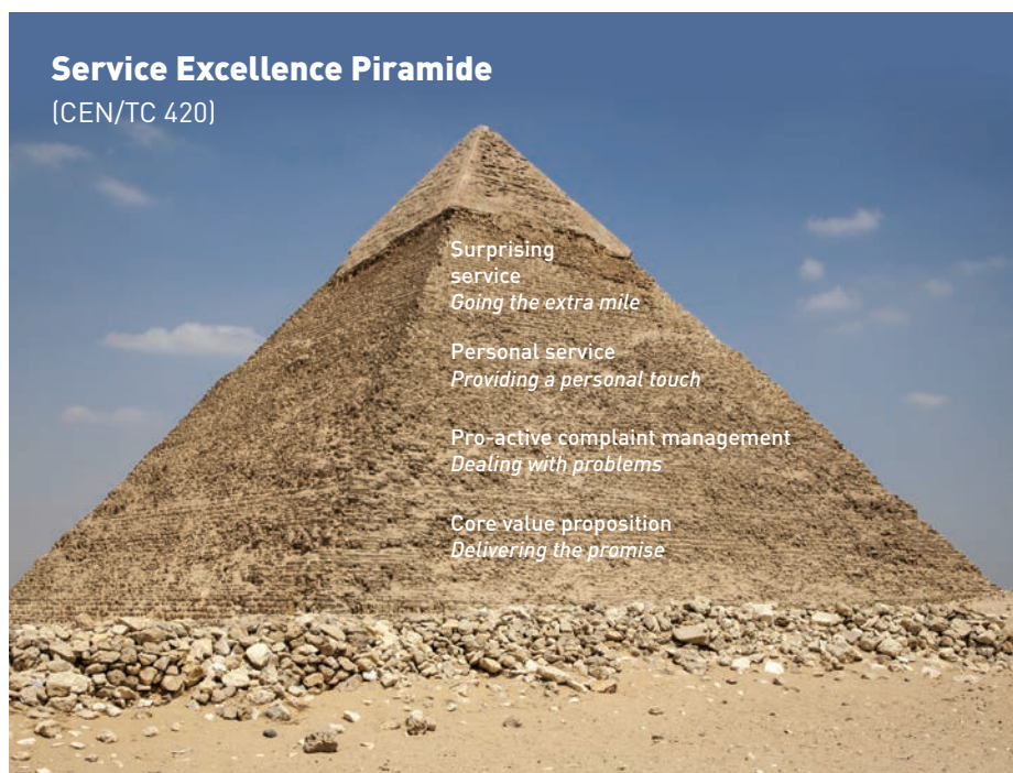
Afbeelding 3: De Service Excellence Piramide.

betekent dat elke medewerker eigenlijk ook klachtenbehandelaar is. Elke medewerker met klantcontact zal klachten moeten herkennen, écht klantgericht omgaan met klachten en moeten weten hoe een klacht op te lossen. Zo wordt klachtbehandeling onlosmakelijk onderdeel van de functie, van het werk en van de cultuur van de organisatie. Organisaties die klachtenmanagement steeds beter ontwikkelen, stappen af van de verbijzondering ervan en integreren klachtenmanagement binnen klantmanagement (customer service, customer care, customer excellence en dergelijke). Zo benadrukken ze dat omgaan met klachten en feedback van klanten 'daily customer practice' is, wat zo veel mogelijk tijdens het eerste contact op- en aangepakt wordt. Zo is bij Robeco de klachtenafdeling inmiddels opgegaan in de afdeling Customer Service.